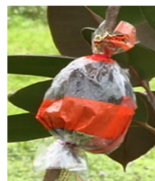
Una pianta di Ficus

http://www.bonsai-italia.it/immagini/margotta#%20bonsai.jpg